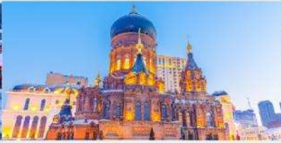
โบสถ์เซนต์โซเฟีย