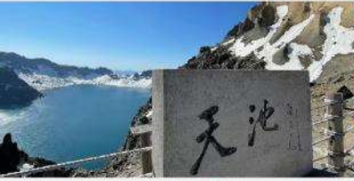
อุทยานฉางไป่ซาน