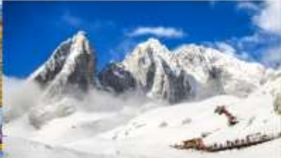
ภูเขาหิมะมิงกรหยก