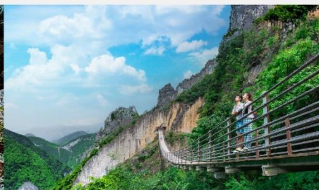
หุบเขารอยแยกอุ๋หลิงซาน