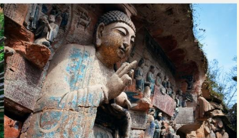
ผาหินแกะสลักต้าจู้ เขาเป่าติงซาน

*ทางบริษัทฯ ขอสงวนสิทธิ์ในการสลับโปรแกรมทัวร์ตามความเหมาะสมขึ้นอยู่กับสถานการณ์หน้างาน โดยคำนึงถึงผลประโยชน์ของลูกค้าเป็นสำคัญ