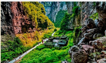
อุทยานแห่งชาติหลุมฟ้า 3 สะพานสวรรค์