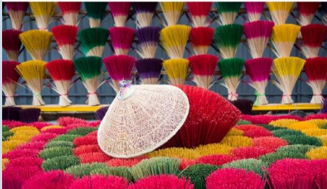
หมู่บ้านรูปหลากสี