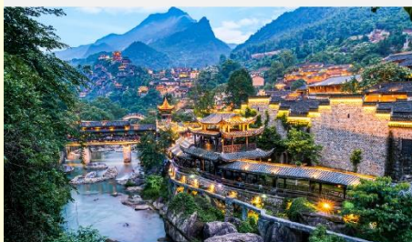
หุบเขาเทวดาฉางเซี่ยนกู่