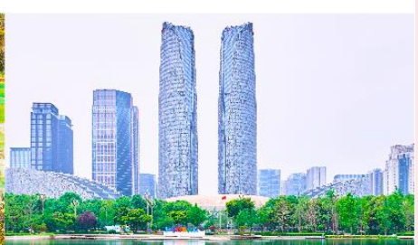
ตึกแพดเจิงตุ

*ทางบริษัทฯ ขอสงวนสิทธิ์ในการสลับโปรแกรมทัวร์ตามความเหมาะสมขึ้นอยู่กับสถานการณ์หน้างาน โดยคำนึงถึงผลประโยชน์ของลูกค้าเป็นสำคัญ