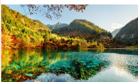
อุทยานแห่งชาติจิวฉ่ายโกว