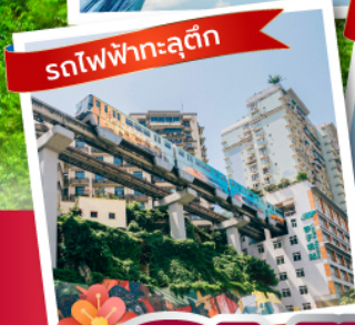
รถไฟฟ้าลัดติ๊ก