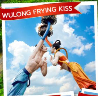
WULONG FRYING KISS