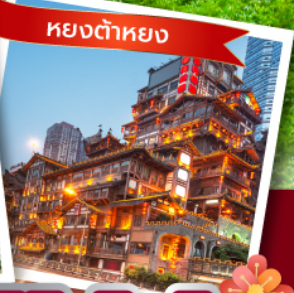
หยงต๋าหยง