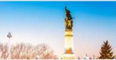
อนุสาวรีย์ผึ้งหง