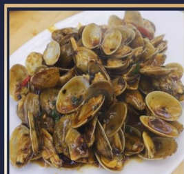
ผัดหอยลาย