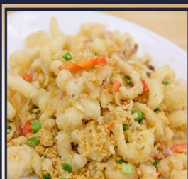
หมึกทอดกระเทียม