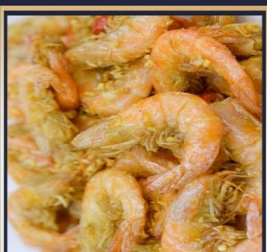
กุ้งทอดกระเทียม