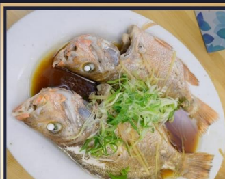
ปลาหนึ่งซี๊ว