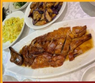
ท่านอย่าง