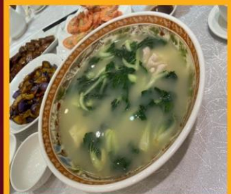
ซุปรสไก่สมุนไพร