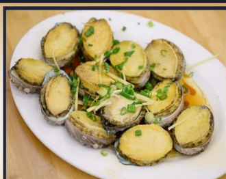
เป่าฮ้อสดหนึ่ง