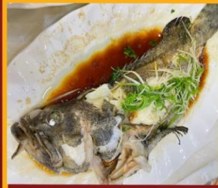
ปลาหนึ่งซีอิ้ว