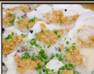
หอยเชลล์อบวุ้นเส้น