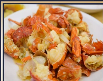
กุ้งมังกรอบซีส