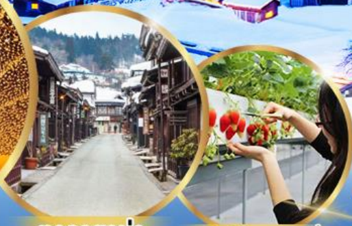
ตากายาม่า