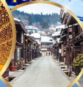
ทาคายาม่า