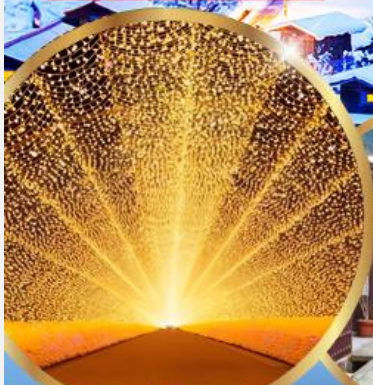
นาคานะ โนะ ซาโตะ