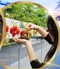
บุฟเฟต์ สดอเบอรี่