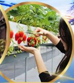
บุฟเฟต์ สดอบอร์รี่