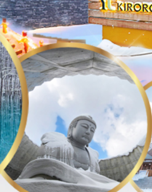
เนินเขาแห่งพระพุทธเจ้า