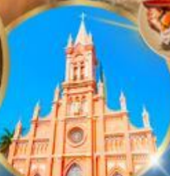
โบสถ์สยามพ