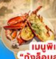
เมนูพิเศษ! "กุ้งลือบสาดอร์"