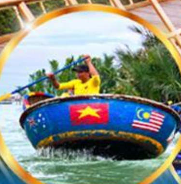
ล่องเรือกระดิง