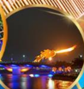
สะพานมังกร