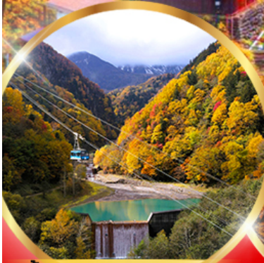
ขึ้นกระเช้าคุโรดากะ

36,919 ราคา เริ่มต้น รวมภาษีมูลค่าเพิ่ม 7%