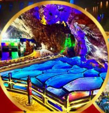
ด่านกนางแอน