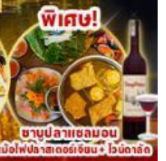
ชาบูปลาแซลมอน หม้อไฟปลาแซลมอนจีน + ไวน์ดิลิต