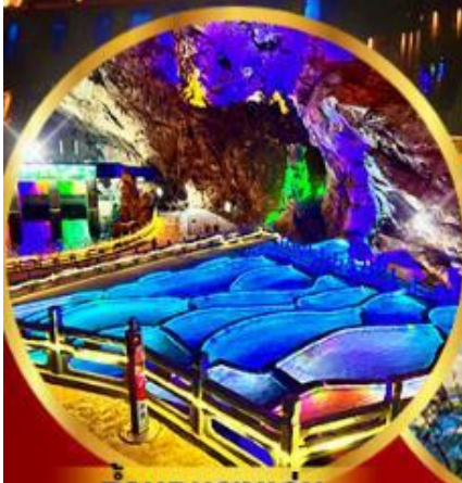
ตำนานทางแอน