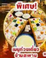
เมนูถ้วยเต๋อชว ข้ามสะพาน