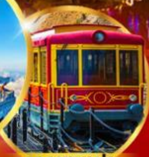
รถรางซาปา