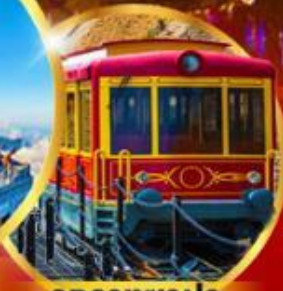
รถรางซาปา