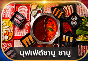
บุฟเฟ่ต์ซาบู ซาบู