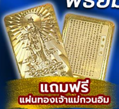
แถมฟรี แผ่นทองเจ้าแม่กวนอิม