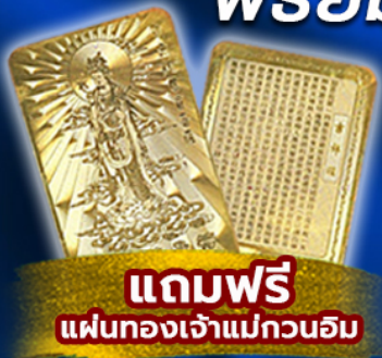
แถมฟรี แผ่นทองเจ้าแม่กวนอิม