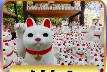
วัดโทโทคุจิ