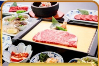
บียง่างร้านดัง ROKKASEN