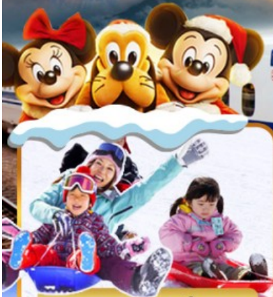
กิจกรรมภาคเลื่อนหิมะ