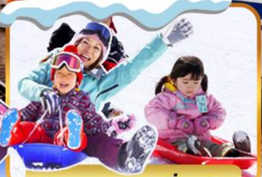
กิจกรรมถอดเสื้อหิมะ