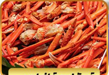
บุฟเฟ่ต์ขาปูยักษ์

ฟรีเดย์โตเกียว 1 วัน อิสระช้อปปิ้งหรือช้อปปิ้งทัวร์เสริมดั่งสนีย์แลนด์ 27 ธ.ค. – 01 ม.ค. 2568