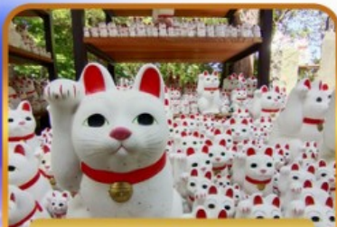
วัดโทโทคุจิ