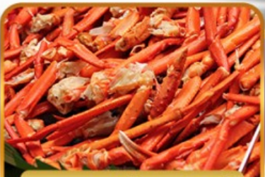
บุฟเฟ่ต์ขาปูยักษ์

ฟรีเดย์โตเกียว 1 วัน อิสระช้อปปิ้งหรือช้อปปิ้งทัวร์เสริมดีสนีย์แลนด์ 27 ธ.ค. - 01 ม.ค. 2568