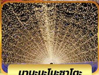
นาบะนะโนะซาโตะ