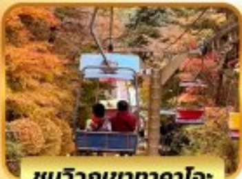
ชมวิวกูเขาทาคาโอะ