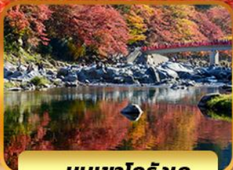
หุบเขาโคริงเค