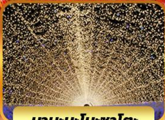
นาบะนะโนะซาโตะ

โอบาระ(ซากุระ) เมืองเกียวโต วัดคิโยมิสึ(วัดน้ำใส) หมู่บ้านชิราคาวาโกะ ถนนซันมาชิซูจิ สะพานนาคาบิชิ ช้อปปิ้ง ซินไซบาชิ ย่านซาคาเอะ อีออน