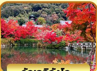
วัดเออิทังโด