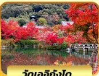
วัดเออิทังโด