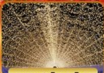
แถบะนะโนะซาโตะ

โอบาระ(ซากุระ) เมืองเกียวโต วัดคิโยมิสึ(วัดน้ำใส) หมู่บ้านชิราคาวาโกะ ถนนชินมาชิซูจิ สะพานนาคามิชิ ซ็อบบิง ซินโซบาชิ ย่านซาคาเอะ อีออน