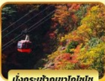
นั่งกระเช้าภูเขาโกโซโซ