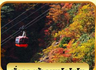
นั่งกระเช้าภูเขาโทไซโซ