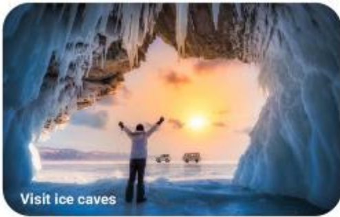
Visit ice caves