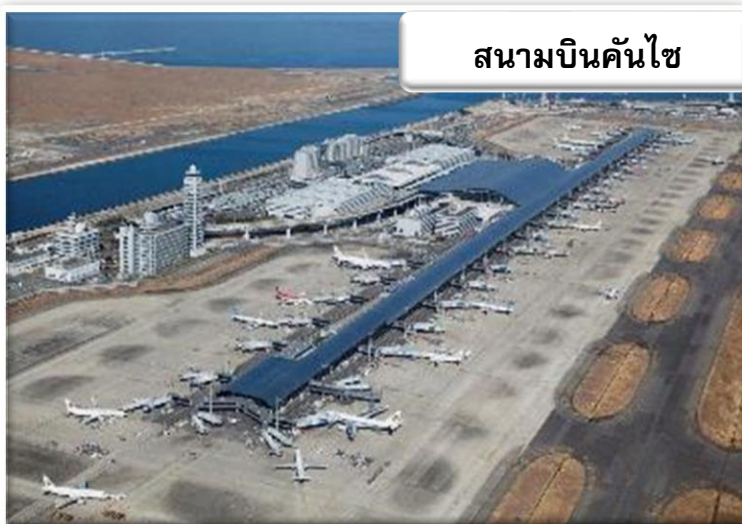
สนามบินคันไซ

เวลา 18.00 น. เดินทางถึง สนามบินคันไซ ประเทศญี่ปุ่น นำท่านผ่านขั้นตอนการตรวจคนเข้าเมืองและศุลกากร