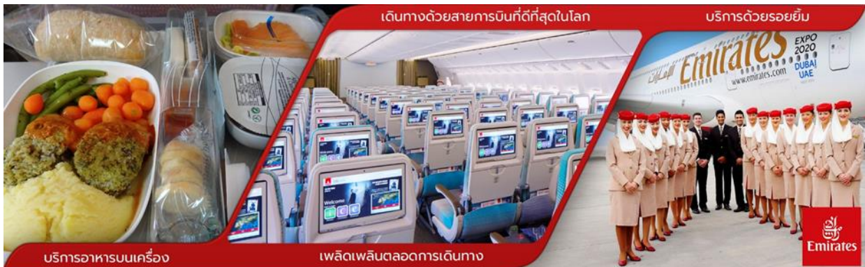
บริการอาหารบนเครื่อง เดินทางด้วยสายการบินที่ดีที่สุดในโลก บริการด้วยรอยยิ้ม เพลิดเพลินตลอดการเดินทาง Emirates

11.00 น. คณะพร้อมกันที่ สนามบินสุวรรณภูมิ ชั้น 4 ประตู 9 เคาน์เตอร์ T สายการบิน EMIRATES โดยมีเจ้าหน้าที่บริษัทคอยให้การต้อนรับ และอำนวยความสะดวกในด้านเอกสาร และการออกบัตรโดยสาร