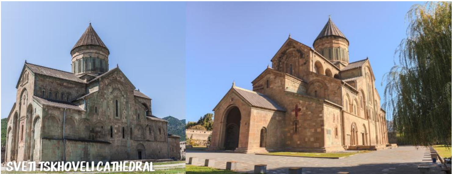
SVETI TSKHOVELI CATHEDRAL

นำท่านไปชม วิหารสเวติสโคเวลี (SVETI TSKHOVELI CATHEDRAL) ซึ่งเป็นโบสถ์อีกแห่งหนึ่งที่อยู่ในบริเวณของมิตสเคต้า ที่มีรูปแบบของจอร์เจียออร์โธดอกถูกสร้างขึ้นในราวศตวรรษที่ 1 โบสถ์แห่งนี้ถือเป็นศูนย์กลางทางศาสนาที่ศักดิ์สิทธิ์ที่สุดของจอร์เจีย สร้างขึ้นโดยสถาปนิกชาวจอร์เจียชื่อ ARSUKISDZE มีขนาดใหญ่เป็นอันดับสองของประเทศอีกทั้งยังเป็นศูนย์กลางที่ทำให้ชาวจอร์เจียเปลี่ยนความเชื่อและหันมานับถือศาสนาคริสต์ และให้ศาสนาคริสต์มาเป็นศาสนาประจำชาติของจอร์เจียเมื่อปี ค.ศ.337 และถือเป็นสิ่งก่อสร้างยุคโบราณที่มีขนาดใหญ่ที่สุดของประเทศจอร์เจีย