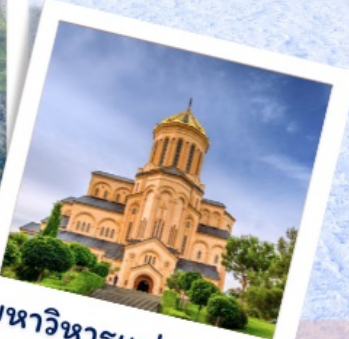
มหาวิหารแห่งทบิลีซี