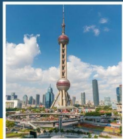
ไข่มุกหอไข่มุก