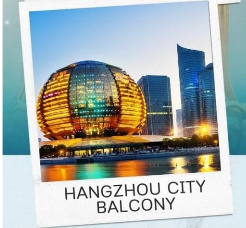
HANGZHOU CITY BALCONY