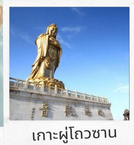
เกาะผู้ไถวซาน