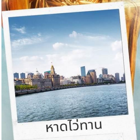
หาดไ่ว่ทาน