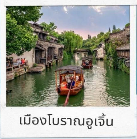
เมืองโบราณอูเจิ้น