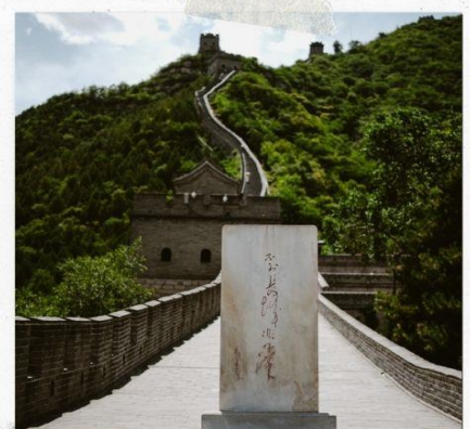
กำแพงเมืองจีน ด่านจวิหยงกวน