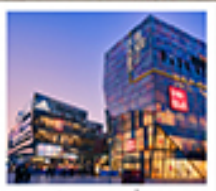
ย่านซานหสึ่ถุน