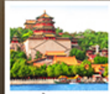
อวี่เหอหยวน