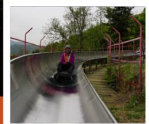
สไลเดอร์ลงจากกำแพงเมืองจีน