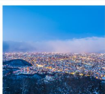
ภูเขาโมอิวะ