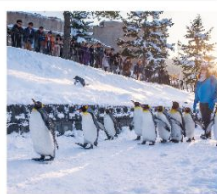
สวนสัตว์อาซาฮิยาม่า

โรงงานขนมหวานริวเก็ตสึ / LAKE AKAN SNOW ACTIVITY ทะเลสาบมะซุ / ล่องเรือตัดน้ำแข็ง / สวนสัตว์อาซาฮิยาม่า บิโอบ สโนว์แลนด์ / ภูเขาโมอิวะ / ตลาดซังกะคุ / พิพิธภัณฑ์ถ้ำถ้ำถ้ำถ้ำ นาฬิกาไอน้ำโบราณ / โรงเป่าแก้วคิตาอิชิ / มิซึย เอ้าเล็คท ถนนช้อปปิ้งทามุกิโคจิ / ย่านซูซุกิโนะ