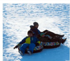
บิโอบ สโนว์แลนด์