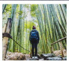
วัดโฮคะคุจิ