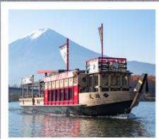
ค่องเรืออาปาเระ