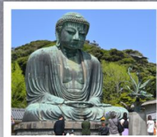
วัดโคโตคุอิน