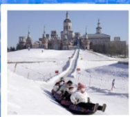
คฤหาสน์นออลการ์