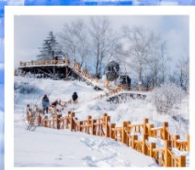
เขาแกะหญา