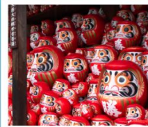
วัดคิตสึโอจิ