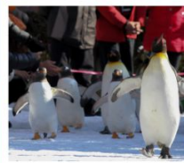
สวนสัตว์นิกะเซ่

วัดคิตสึโอจิ / ปราสาทโอซาก้า / ย่านชินไซบาชิ คองเรือทะเลสาบโทยะ / โทเรียวคะคุ ทาวเวอร์ โกดังอิฐแดงคานโบริ / นังกระซำกุซาฮาโกดาเตะ ตลาดเช้าเมืองฮาโกดาเตะ / สวนสัตว์นิกะเซ่ มารินพาร์ค พิพิธภัณฑ์หอคองดนตรี / นาฬิกาไอน้ำโบราณ โรงเบ้าแก้วคิตาอิชิ / เนินพระพุทธรเจ้า / มิซุยะ เอ้าเล็ท