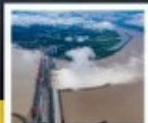
เขื่อนอี่ก่งสามเสี้ยวต้าป้า

ทัวร์กรุ๊ปธรรม ไม่ลงร้านช้อปปิ้ง • ไม่ขายออฟชั่น