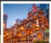
พหุเขาดิ่ง