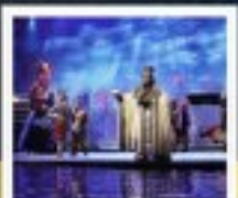
โชว์สามก๊ก

มหาศาลาประชาม / จตุรัสเทียนเหมิน หงหยาดิ่ง / ถนนเก่าด้านจื่อ / ล่องเรือสำราญ แม่น้ำแยงซีเกียง โชว์สามก๊ก / ช่องแถบชวีกึ่งเสี่ย / ช่องแถบดูเสี่ย / นั่งเรือฝึกชมเส้นหนี่ซี ชมเขื่อนสามเสี้ยวต้าป้า / นั่งลิฟท์ข้ามเขื่อนสามเสี้ยวต้าป้า / พิธีกรักท้อเขื่อนสามเสี้ยว