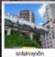
ต่งเป่เอ๋นฉัก

ทัวร์กรุ๊ปธรรม ไม่ลงร้านซื้อป๋นจิ่ง • ไม่ขายออฟชั่น