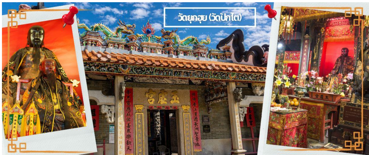
วัดยุคซุย (วัดปักไต่)

จากนั้นนำท่านเดินทางสู่ วัดปักไต่ เป็นสถานศักดิ์สิทธิ์ที่มีประวัติมายาวนาน 160 ปี ในเขต WAN CHAI เป็นวัดที่บูชาเทพเจ้าแห่งท้องทะเลในลัทธิเต๋า และชาวฮ่องกงเชื่อกันว่าผู้ใดที่เกิดปีชง หากมาทำการแก้ดวงชะตาแก้ชงประจำปีที่วัดนี้ จะทำให้ร้ายกลายเป็นดีได้ และที่วัดยังมี “เทพเจ้าเปลี่ยนใจ” ที่นิยมมาขอพรให้เรื่องที่ไม่ดีกลายเป็นเรื่องดี หรือคนที่เป็นคนศัตรูของเราเปลี่ยนใจมาเป็นมิตร จึงเป็นที่นิยมอย่างมากของชาวท้องถิ่น