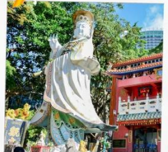
เจ้าแม่กวนอิมรพัสลอบย์

23 กุมภาพันธ์ 2568 วันยมเงินเจ้าแม่กวนอิม วัดฮ่องฮำ