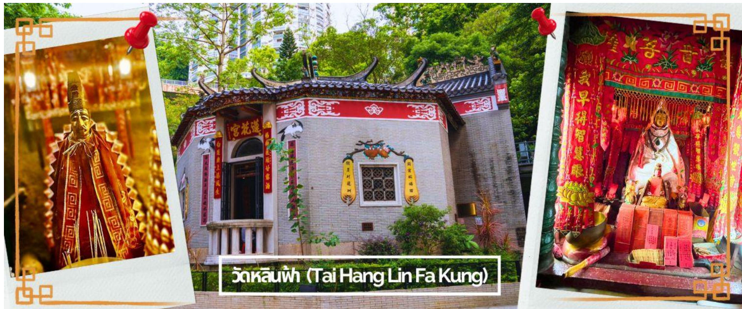
วัดหลินฟู่ (Tai Hang Lin Fa Kung)