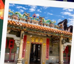
วัดปึกโต