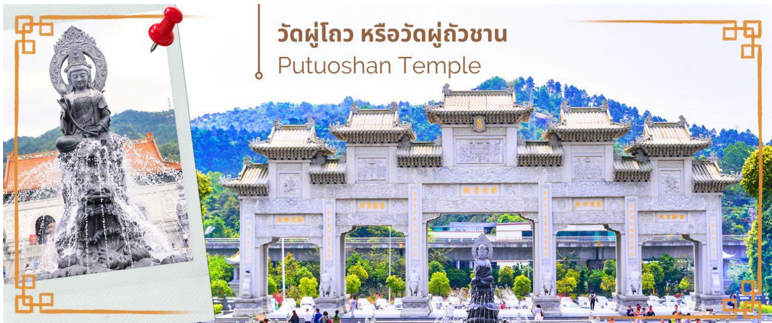
วัดผู้โถว หรือวัดผู้ถัวชาน Putuoshan Temple

จากนั้นนำท่านสู่ วัดผู้โถว หรือวัดผู้ถัวชาน (Putuoshan Temple) ดินแดนอันศักดิ์สิทธิ์ ของพระโพธิสัตว์กวนอิม พุทธศาสนิกายมหายาน พระโพธิสัตว์กวนอิมคืออวตารหนึ่งของพระอมิตาภพุทธเจ้า ซึ่งพระโพธิสัตว์กวนอิมเป็นมหาบุรุษมีวัฒนธรรมโดยรวมกว้างขวางและออกแบบด้วยรูปแบบสถาปัตยกรรมโบราณแบบดั้งเดิม