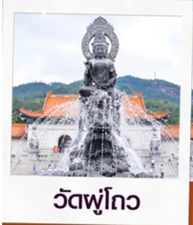
วัดฟูโกว