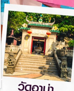
วัดอาแม่