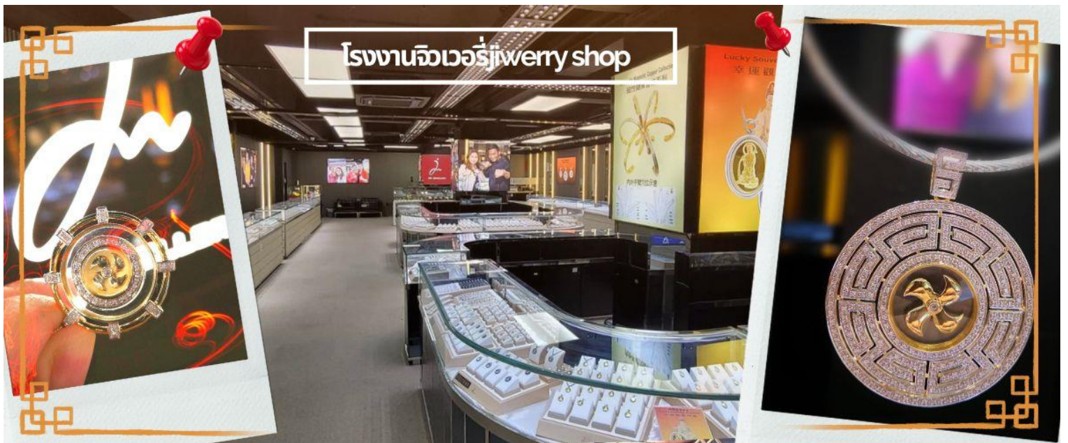
โรงงานจิวเวอรี่jewery shop

จากนั้นนำท่านชม โรงงานจิวเวอรี่ ซึ่งเป็นโรงงานที่มีชื่อเสียงที่สุดของฮ่องกงในเรื่องการออกแบบเครื่องประดับ อาทิเช่น จี้ และแหวนกำหั้น ที่สวยงามโดดเด่นไม่เหมือนใคร ซึ่งถือกำเนิดขึ้นที่นี่และมีชื่อเสียงที่สุดใช้เป็นเครื่องประดับติดตัว และเสริมดวงชะตา สินค้าทุกชิ้นมีเอกสารรับประกันคุณภาพเปลี่ยน ซ่อม ได้ตลอดอายุการใช้งาน หากเกิดการชำรุดจากสินค้าไม่ใช่อุบัติเหตุ