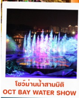
โชว์น้ำสามมิติ OCT BAY WATER SHOW