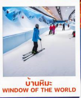
บ้านหิมะ WINDOW OF THE WORLD