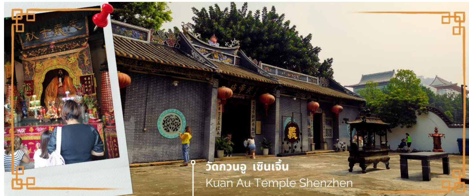
วัดกวนอู เซินเจิ้น Kuan Au Temple Shenzhen

เช้า 🍷 บริการอาหารเช้า ณ ห้องอาหารของโรงแรม (3) จากนั้นนำท่านเดินทางสู่ วัดกวนอู ไหว้เทพเจ้ากวนอู สัญลักษณ์ของความซื่อสัตย์ ความกตัญญูรู้คุณ ความจงรักภักดี ความกล้าหาญ โชคลาภ และบารมี ท่านเปรียบเสมือนตัวแทนของความเข้มแข็งเด็ดเดี่ยวของอาจไม่ครั้นคร้ามต่อศัตรู ท่านเป็นคนจิตใจมุ่งมั่นคงตั้งขุนเขา มีสติปัญญาเฉลียวฉลาด และไม่เคยประมาทการบูชาขอพรท่านก็หมายถึงขอให้ท่านช่วยอุดช่องว่างไม่ให้เพลิงพลั่วแก่ฝ่ายตรงข้าม และให้เกิดความสมบูรณ์ด้วยคนข้างเคียงที่ซื่อสัตย์ หรือบริวารที่ไว้วางใจได้นั้นเองดังนั้นประชาชนคนจีนจึงนิยมบูชา และกราบไหว้เพื่อความเป็นสิริมงคลต่อตนเอง และครอบครัวในทุกๆ ด้าน