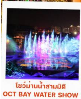
โชว์น้ำสามมิติ OCT BAY WATER SHOW