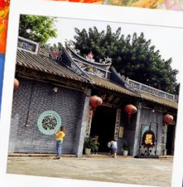
วัดกวนอูเซินเจิ้น