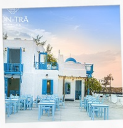
ซานตารีนาคาเฟ่