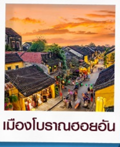
เมืองโบราณฮอยอัน