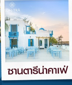
ซานตารีนาคาเฟ่