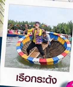
เรือกระดิง