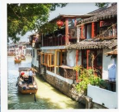
เมืองโบราณจูเจียเจี๋ย