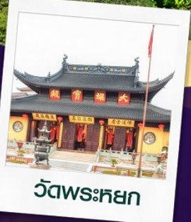
วัดพระหยก