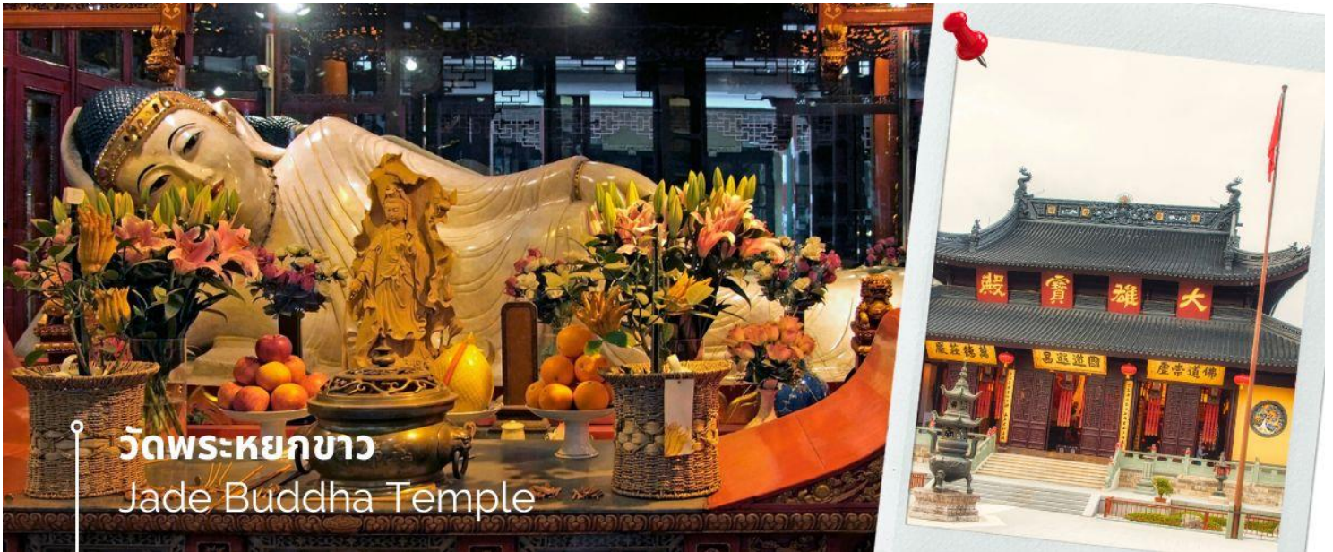
วัดพระหยกขาว Jade Buddha Temple

เช้า 10 รับประทานอาหารเช้า ณ ห้องอาหารโรงแรม (10) นำท่านชม วัดพระหยกขาว Jade Buddha Temple เป็นวัดที่มีชื่อเสียงมากที่สุดในเมืองเซี่ยงไฮ้ ซึ่งเป็นที่รู้จักจากพระพุทธรูปสององค์ที่สร้างขึ้นจากหยกทั้งแท่ง องค์พระพุทธรูปปางนั่งมีความสูง 190 เซนติเมตร และ หุ้มด้วยเพชรพลอย หิน มอโนรา และ มรกต และองค์พระพุทธรูปปางไสยาสน์ มีความยาว 96 เซนติเมตร นอนเอียงด้านขวาและหนุนพระเศียรด้วยพระหัตถ์ขวา ถือเป็นวัดที่มีทั้งชาวจีนและนักท่องเที่ยวเดินทางมาสักการะบูชาตลอดทั้งวัน