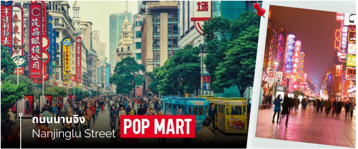
ถนนนานจิง Nanjinglu Street POP MART

และนำท่านช้อปปิ้งย่าน ถนนนานจิง Nanjinglu Street ศูนย์กลางสำหรับการช้อปปิ้งที่คึกคักมากที่สุดของนครเซี่ยงไฮ้ รวมทั้งห้างสรรพสินค้าใหญ่ชื่อดังกว่า 10 แห่ง และช้อปปิ้ง ร้าน POP MART สุดฮิตในขณะนี้เพื่อเป็นของฝากที่ระลึกให้แก่ญาติสนิทมิตรสหาย