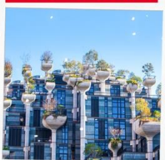
Tian An 1,000 Trees Square