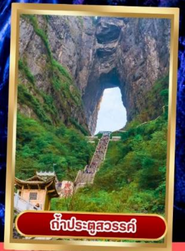
ถ้ำประตูสวรรค์