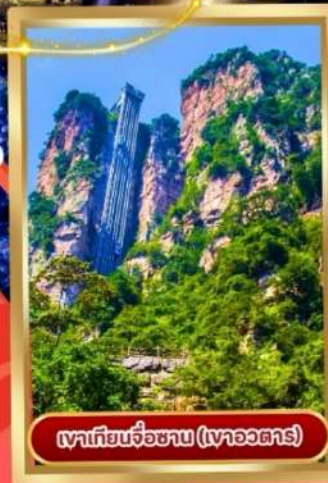
เขาเทียนจื่อซำบ (เขาวงตาร)

• ตึกมหัศจรรย์ 72 ชั้นแห่งเมืองจากเจี๋ยเจี๋ย