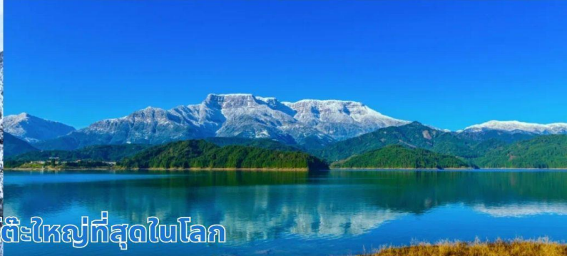
ภูเขาหิมะวาวู ภูเขาโต๊ะใหญ่ที่สุดในโลก