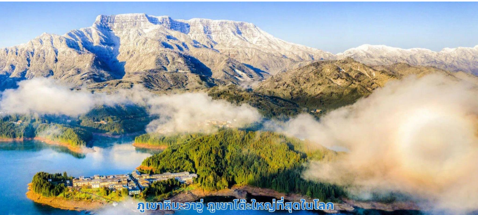
ภูเขาหิมะวาวู ภูเขาโต๊ะใหญ่ที่สุดในโลก