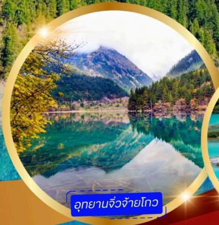
อุทยานจิวโจโกว