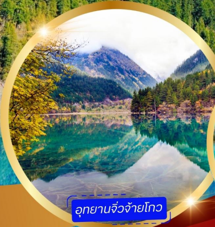
อุทยานจิวโจโกว