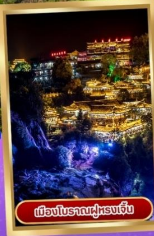
เมืองโบราณฝูหลงเจิ้น