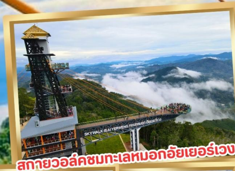
สกายวอล์คชมทะเลหมอกอัยเยอร์เวง

ร่วมโครงการ ลดหย่อนภาษี ลดสูงสุด 15,000.-