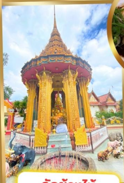
วัดช้างไห้