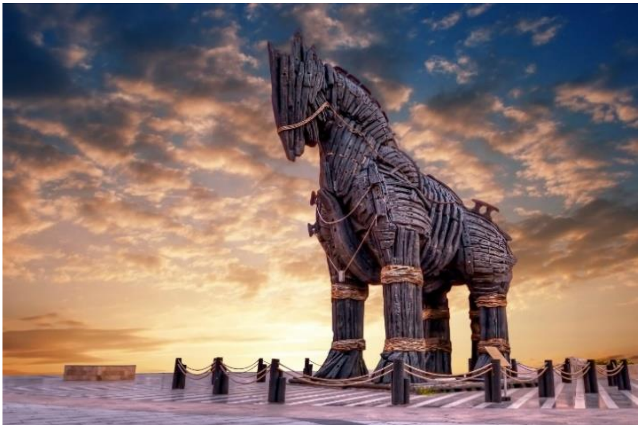
นำท่านชมและถ่ายภาพ ม้าไม้จำลองเมืองทรอยริมทะเล (TROJAN STATUE/HOLLYWOOD HORSE) เป็นม้าไม้ที่มีชื่อเสียงโด่งดังมากที่สุดจากมหากาพย์ภาพยนตร์ฮอลลีวูดเรื่อง ทรอย (Troy) ในปี 2004 มีแบรด