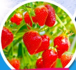
ไร้สตรอว์เบอร์รี่

• สายจุ่มห้ามพลาด!! ไอเทมดัง POP MART ตลาดดัง เมียงดง + ฮงแด