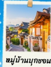
หมู่บ้านนูกซอน