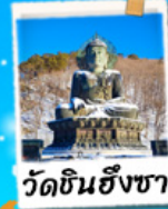
วัดชินฮังซา