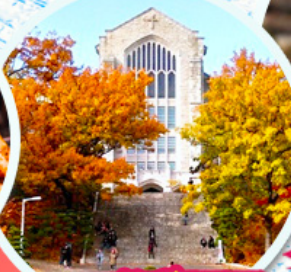
มหาวิทยาลัยอีฮวา