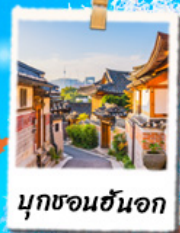
นุกซอนฮันอก