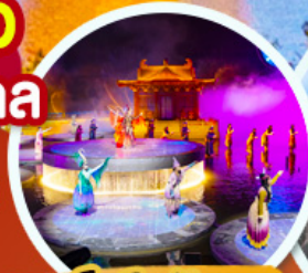
ชมโชว์อุทนีโจว