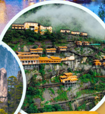
หมู่บ้านเทวดา