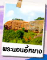
พระนอนอภัย