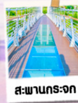
สวนกระจุก