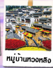
หมู่บ้านทองหลาง