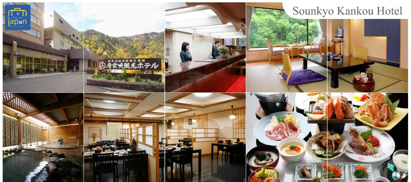
Sounkyo Kankou Hotel

หลังอาหารให้ท่านได้ผ่อนคลายกับการแช่น้ำแร่ธรรมชาติ เชื่อว่าถ้าได้แช่น้ำแร่แล้ว จะทำให้ผิวพรรณสวยงามและช่วยให้ระบบหมุนเวียนโลหิตดีขึ้น